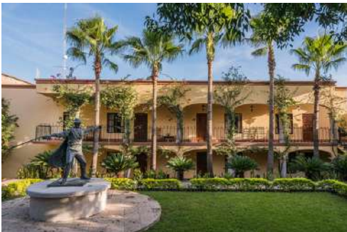
Hotel Posada del Hidalgo, El Fuerte