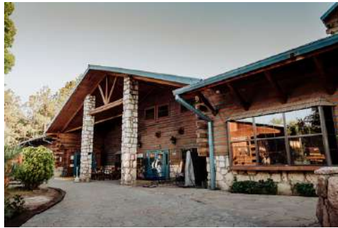
Hotel The Lodge At Creel, Creel