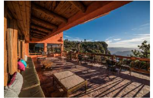
Hotel Mirador, Divisadero