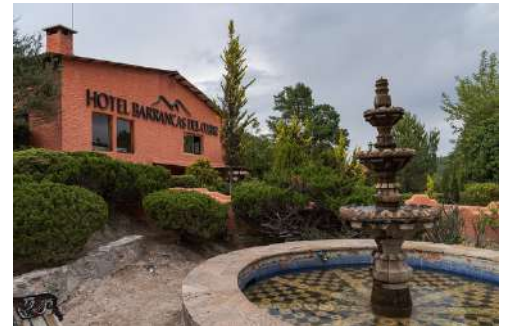
Hotel Barrancas del Cobre, Divisadero

IMPORTANTE: Todos los hoteles están sujetos a disponibilidad, se pueden sustituir por otros de la misma categoría. En caso de no haber disponibilidad en El Fuerte, se cambiará por un hotel en Los Mochis (Hotel Santa Anita) sin costo adicional.