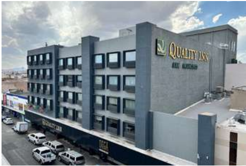
Hotel Quality Inn, Chihuahua