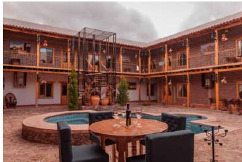
Hacienda Don Armando, Creel