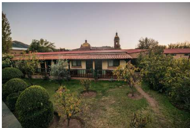
Hotel Misión, Cerochahui