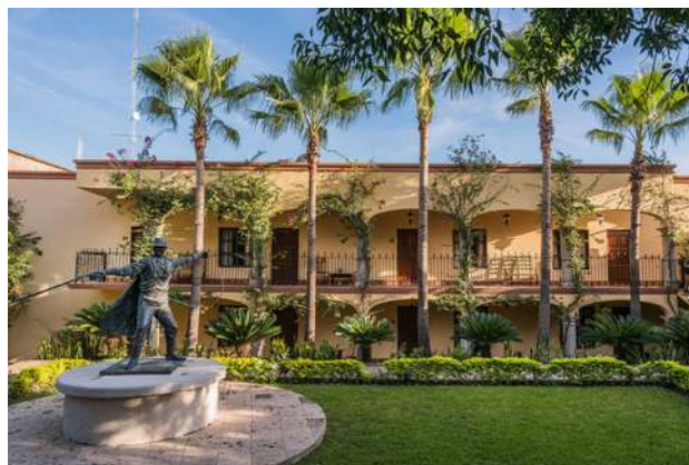
Hotel Posada del Hidalgo, El Fuerte

IMPORTANTE: Todos los hoteles están sujetos a disponibilidad, se pueden sustituir por otros de la misma categoría. En caso de no haber disponibilidad en El Fuerte, se cambiará por un hotel en Los Mochis (Hotel Santa Anita) sin costo adicional.