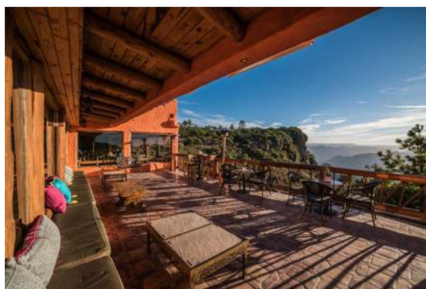
Hotel Mirador, Posada Barrancas