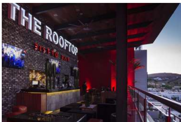
Hotel Ramada, Chihuahua